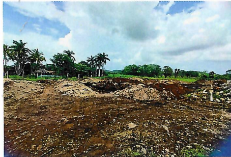
F1: Edificio B