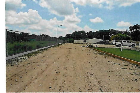
F5: Carril de acceso