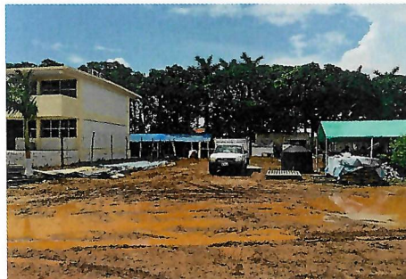
F3: Plaza Cívica